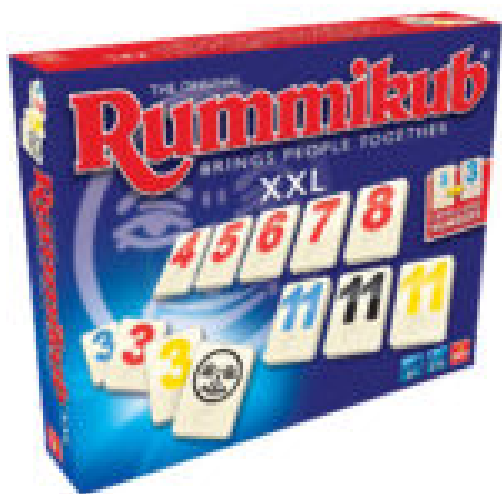
Rummikub grootletter en