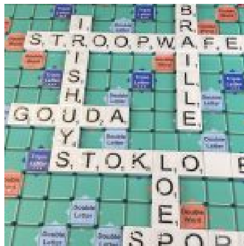
Scrabble grootletter en braille