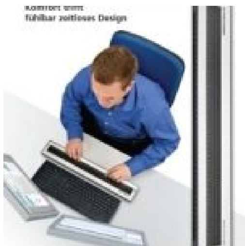
Papenmeier BRAILLEX EL 80c