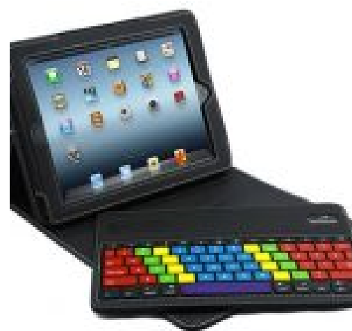
iPad-hoes met grootlettertoetsenbord