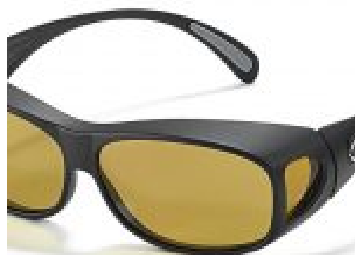
Multilens Biocover overzet filterbril (grijs filter en zwart