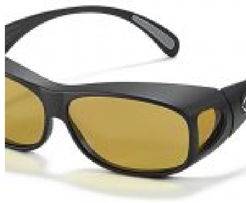
Multilens Biocover overzet