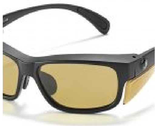
Multilens filterbril Sun Guard 1